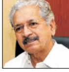
सुभाष देसाई उद्योग मंत्री