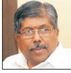
चंद्रकांतदादा पाटील राहकार, पणन आणि वस्त्रोद्योग, सार्वजनिक बांधकाम मंत्री (सार्वजनिक उपक्रम वगळून)