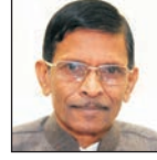
विष्णू सावरा आदिवासी विकास मंत्री