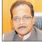
राजकुमार बडोले सामाजिक न्याय आणि विशेष राहत्य मंत्री