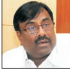
सुधीर मुनगंटीवार वित्त व नियोजन, वन मंत्री