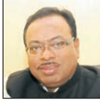
चंद्रशेखर बावनकुळे उर्जा, नवीन व नवीनीकरण उर्जा मंत्री