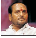
रामदास कदम पर्यावरण मंत्री