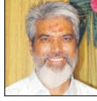
दादाजी भुसे राहकार राज्यमंत्री