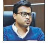
राजे अंबरिशाराव राजे सत्यवानराव आत्राम आदिवासी विकास राज्यमंत्री