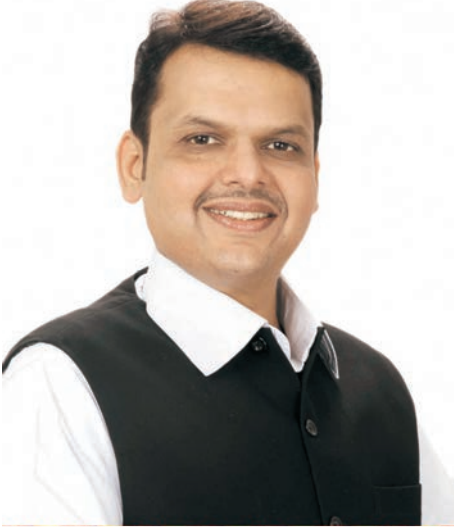
श्री देवेंद्र फडणवीस मुख्यमंत्री

मुख्यमंत्री देवेंद्र फडणवीस यांच्या नेतृत्वातील सरकारला ७ फेब्रुवारी २०१५ रोजी १०० दिवस पूर्ण होत आहेत. या शंभर दिवसांतील सरकारची कामगिरी जनतेपुढे रिपोर्ट कार्डच्या रूपाने सादर करण्याचा हा प्रयत्न. बहुतेक सारे निर्णय यात समाविष्ट करण्यात आले आहेत.